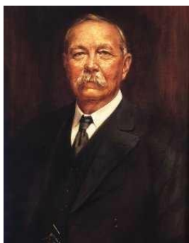
Артур Конан Дойл (1859-1930)