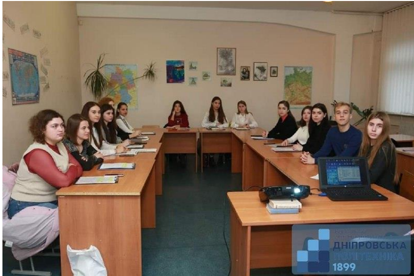
Виступи учасників конференції Євромови : «Інновації та розвиток», секція галузевого науково-технічного перекладу