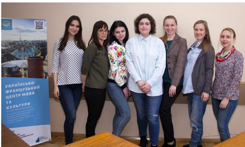
Учасники конференції Євромови : «Інновації та розвиток», секція французької мови