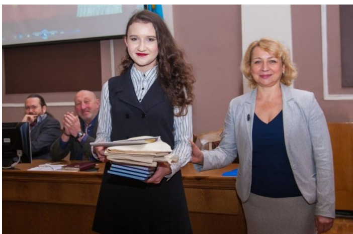
Нагородження переможців конкурсу поетичного перекладу