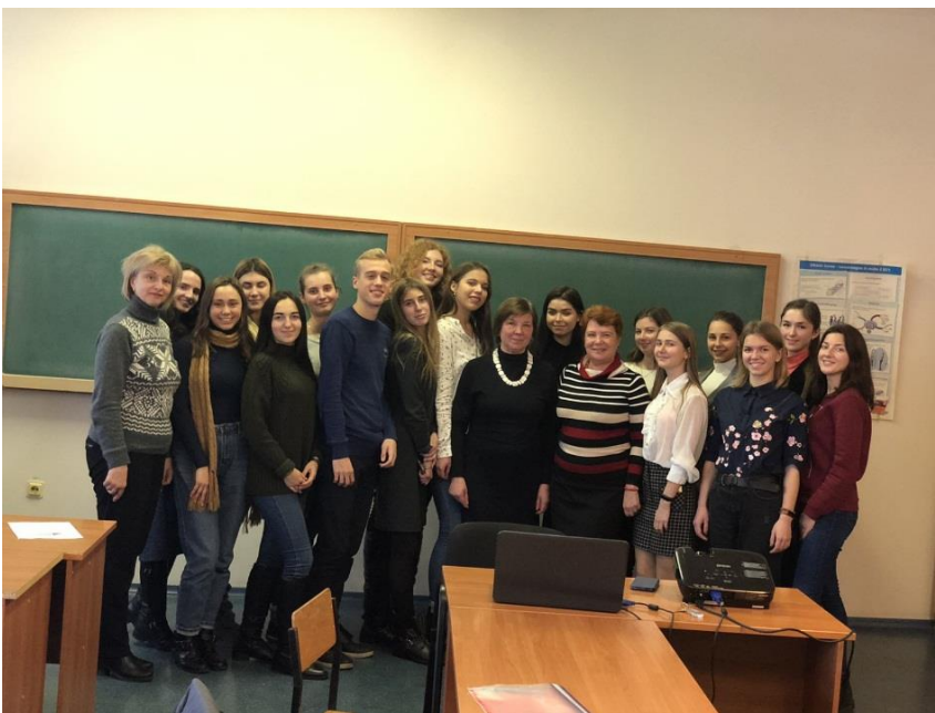
Початок роботи секції «Іноземні мови як засіб ділової та наукової комунікації»