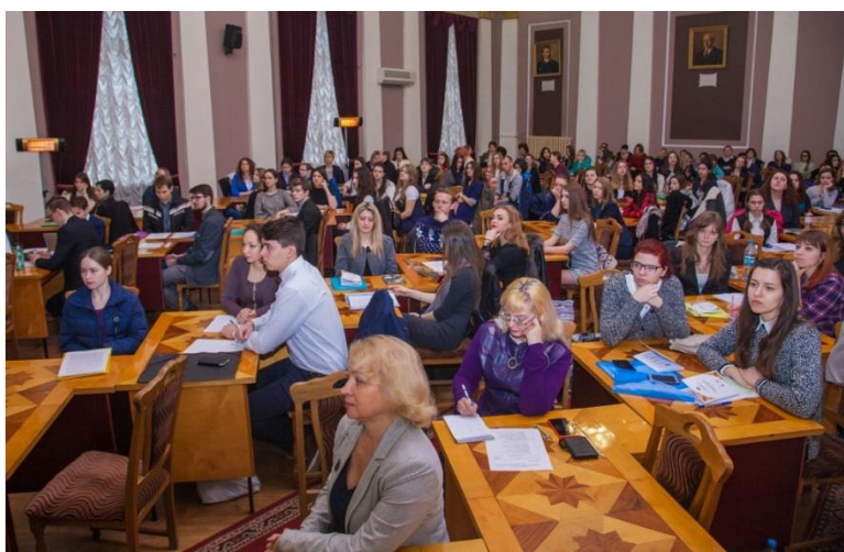
Міжнародна науково-практична конференція Євромови : «Інновації та розвиток»