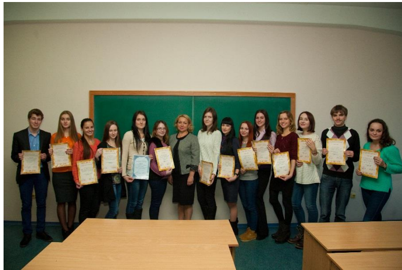
Нагородження учасників конференції Євромови : «Інновації та розвиток», секція німецької мови