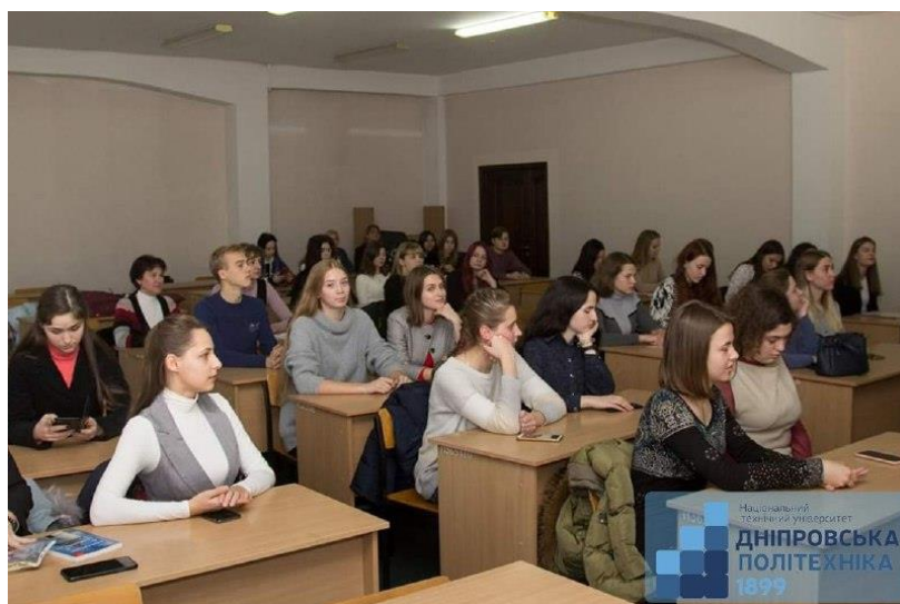
Підведення підсумків конференції Євромови : «Інновації та розвиток»